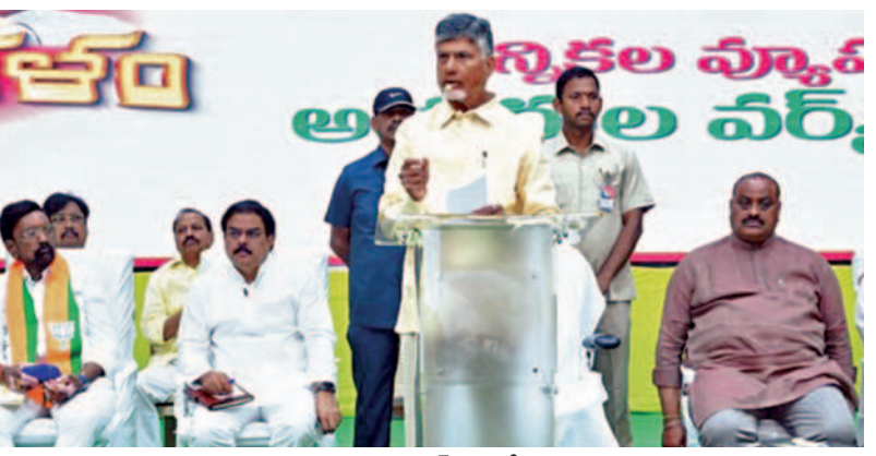
శనివారం ఎన్నికల పూర్వం లభ్యరూల వర్క్ షాపులో మాట్లాడుతున్న చంద్రబాబు. వేదికపై టి.పి. జనసేన, బిజెపి నేతలు

24 ఎంపీ స్థానాల్లోనూ గెలుపు సీట్లు త్యాగం చేసినవారిని మర్చిపోను రాష్ట్ర ప్రయోజనాలే లక్ష్యంగా మూడు పార్టీల పాత్తు 'కూటమి' ఎమ్మెల్యే, ఎంపీ లభ్యరూల వర్క్ షాపులో చంద్రబాబు