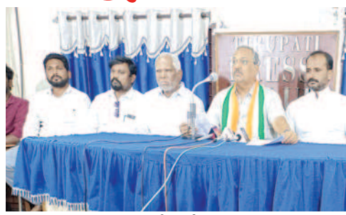
సమావేశంలో మాట్లాడుతున్న కాంగ్రెస్ పార్టీ నాయకులు

తిరుపతి పార్టీ, మార్చి 23. ప్రభాతవార్త: రానున్న ఎన్నికలను దృష్టిలో ఉంచుకుని ప్రతిపక్షాలను బలహీనం చేయడానికి తెలంగాణలో టిఆర్ఎస్ అధినేత కేసీఆర్ కుమార్తె కవితను అలాగే ఆమె ఆధ్వర్యంలో స్థాపకులు, ఢిల్లీ సిఎం అరవింద్